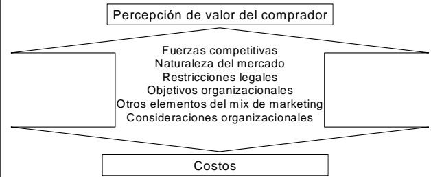
Figura 1. Orientación conceptual de precios