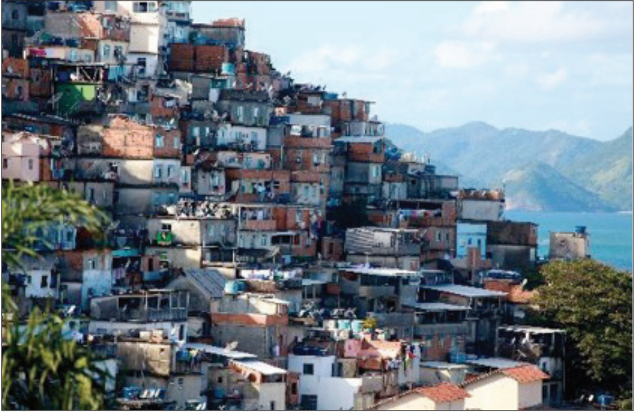
Figura 1. Morro do Cantagalo, entre Copacabana e Ipanema