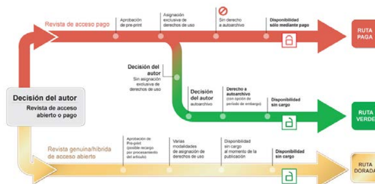
Figura 3. Rutas de publicación científica.