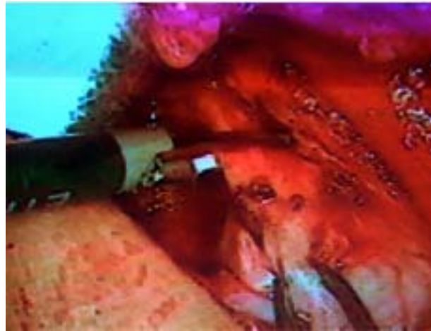
Figuras 3A-3B. Sección del pedículo tiroideo superior.