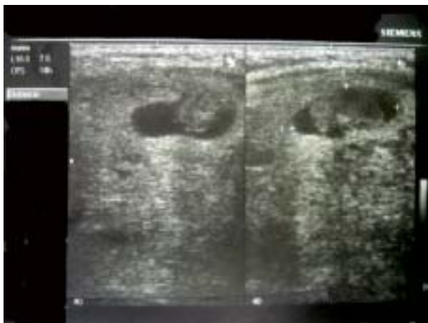
Figura 1. Carcinoma papilar en nódulo quístico tiroideo.

Lo mismo sucede a nivel quirúrgico, en el momento que se planifica para la resección de nódulos tumorales o sospechosos, lo cual, la lobectomía e istmectomía es la biopsia mínima como procedimiento estándar. La tiroidectomía es una de las operaciones más comunes