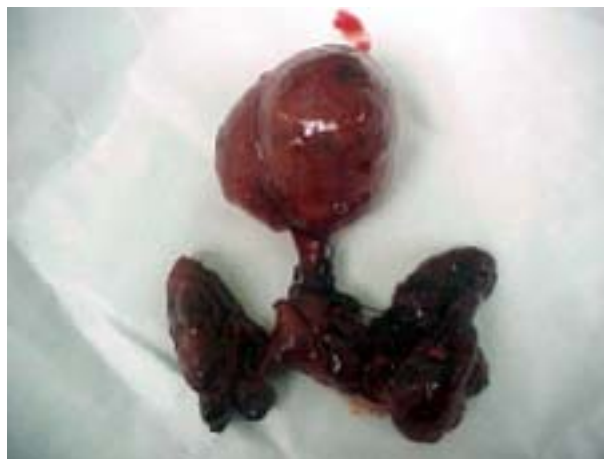
Figura 2. Bocio multinodular. Nódulo en la pirámide.

Cincuenta pacientes fueron incluidos en el presente estudio, realizado en el Hospital Oncológico Padre Machado y en el Instituto Médico La Floresta, en Caracas, entre febrero de 2004 y enero de 2006; donde se tomaron como criterios de inclusión, pacientes con indicación de cirugía tiroidea, ya sea por nódulos sospechosos o con diagnóstico de cáncer de tiroides, bocio multinodular, mayores de 18 años (Figura 2). Los criterios de exclusión