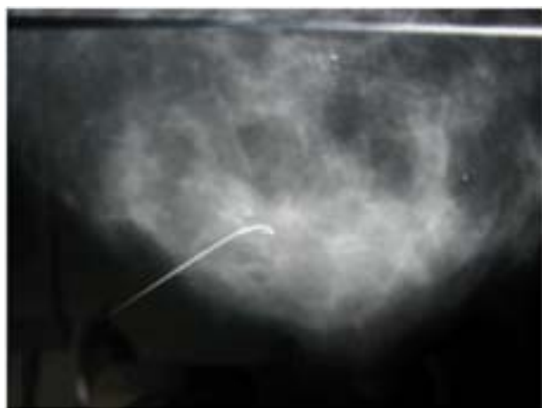
Figura 1. Aguja-arpón en acúmulo de microcalcificaciones

aguja de localización y se realizan de nuevo estudios mamográficos para comprobar su correcta colocación (Figura 1). Luego la paciente es intervenida quirúrgicamente realizándose la resección de la lesión subclínica guiada mediante la aguja-arpón (biopsia escisional). Una vez concluida la resección fue llevada la pieza operatoria a estudios radiológicos para confirmar la exéresis de la lesión subclínica con la aguja-arpón y finalmente es enviada al departamento de anatomía patológica para su estudio. En el grupo de pacientes que se realizó la localización con semilla de yodo 125 (ROLL), la inserción se practica antes del día de la intervención quirúrgica. Bajo orientación mamográfica, se coloca una semilla de yodo 125 utilizándose una aguja de inserción de semillas. Una vez retirada la aguja de inserción de semillas, se realizan 2 proyecciones mamográficas (lateral y céfalo-caudal) para su comprobación (Figura 2). El día de la intervención quirúrgica, utilizando una sonda de detección quirúrgica de radioelementos (Eurorad Modelo Europrobe S/ N 0092) se analiza la medida de la radiación emitida por la semilla preoperatoriamente, determinándose el sitio de la incisión en la piel