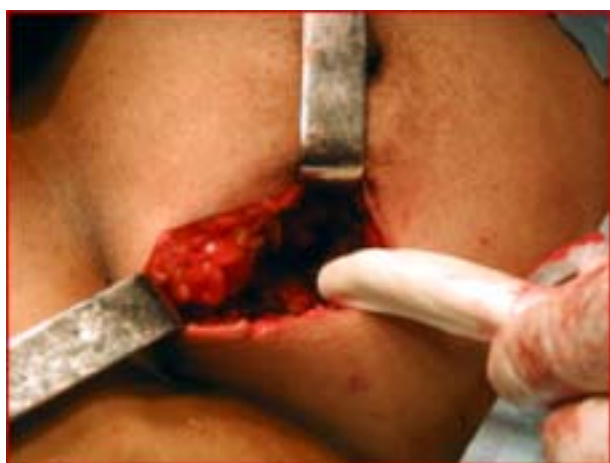
Figura 3. La sonda orienta la extirpación de la lesión.

de la mama. Una vez en el acto operatorio se procede a localizar el tejido mamario donde se encuentra la lesión subclínica utilizando como referencia la detección de la semilla de yodo 125 por la sonda captadora de emisiones gamma (Figura 3). Una vez concluida la resección (biopsia escisional) la muestra de tejido mamario es llevada a estudios radiológicos para confirmar la exéresis de la lesión subclínica y luego es enviada al servicio de anatomía patológica. La semilla de yodo 125 es proveniente de las utilizadas para el tratamiento radiante de cáncer de próstata. Tienen una longitud de 0,5 cm y son emisoras de fotones gamma. Estas semillas ya han perdido su capacidad terapéutica, quedando solamente una pequeña cantidad de radiación, calculada en 0,0064 mCi, inocua para el paciente y el personal de salud. Una vez clasificadas, son esterilizadas y preparadas para su uso. La sonda de detección de radio elementos Eurorad Modelo Europrobe, es un equipo diseñado para la localización precisa durante la cirugía de áreas donde esté incrementada la actividad de elementos radiantes, particularmente emisores de radiaciones gamma, por ejemplo en la identificación del ganglio centinela en cáncer de mama y melanoma.