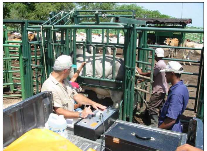
Fotografía 4. Extracción de semen de toro con electro eyaculador.