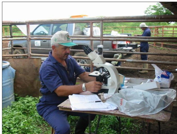
Fotografía 6. Evaluación de semen de toro en campo.

Una vez extraída cada muestra de semen, fue trasladada a un laboratorio móvil ubicado cercano al brete de extracción de semen, protegiéndola durante su traslado de la exposición al sol, para evitar cambios en sus características. En el laboratorio se mantuvo la temperatura del semen a 37°C en baño de María, durante la realización de la evaluación de las características macro y microscópicas. Las características macroscópicas incluyeron: color (1=lechoso; 2=cremoso; 3=acuoso), aspecto (1=denso; 2=denso medio; 3=ralo) y olor (1= sui generis ), según Zemjanis 14 . La evaluación de las características microscópicas se realizó siguiendo el protocolo de la Sociedad de Theriogenología 13 , y se incluyó la motilidad masal (MM: ++++=1; +++=2; ++=3; +=4; 0=5) y la motilidad individual MI (%), tomándose en cuenta únicamente los espermatozoides con movimiento lineal progresivo. Luego de evaluar la calidad espermática, se procedió a hacer la observación final para clasificar a los toros como satisfactorio (1), cuestionable (2) y/o insatisfactorio (3). Los datos obtenidos fueron analizados mediante el paquete estadístico INFOSTAT® 2002 versión 1.1 15 , a través de prueba de hipótesis para dos medias muestrales; basada en la distribución de “t” de Student para muestras independientes, considerando tamaño de muestras y varianzas desiguales (fotografías 5 y 6).