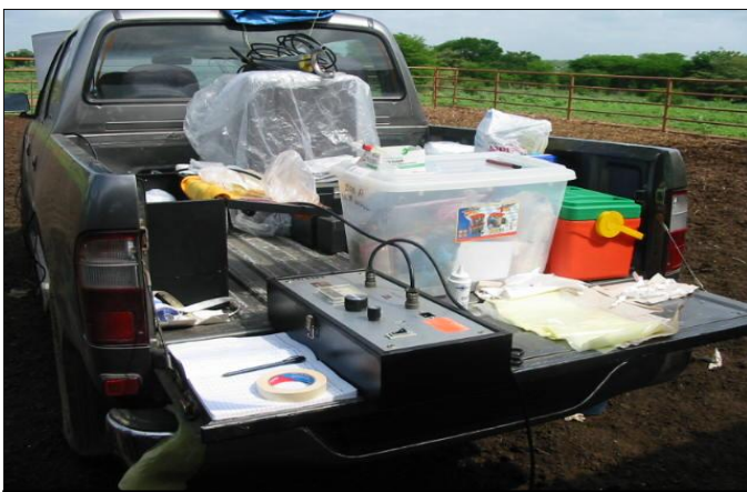
Fotografía 1. Materiales y suministros para evaluar semen de toros en fincas del Llano Central Venezolano.