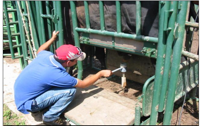
Fotografía 2. Brete para sujetar toros para extracción de semen.

Para la extracción de semen, fue utilizado un electro-eyaculador (Pulsator II ® ), dotado de una sonda de 3 electrodos, realizándose estímulos eléctricos pulsátiles en forma creciente hasta lograr la eyaculación de los toros. Durante la recolección se descartó la primera fracción de semen (secreción de las glándulas accesorias), tomándose para la evaluación la segunda fracción del eyaculado, la cual es rica en espermatozoides, en un tubo aforado hasta 15 mL para medir el volumen del eyaculado de cada toro (fotografías 1, 2, 3 y 4).