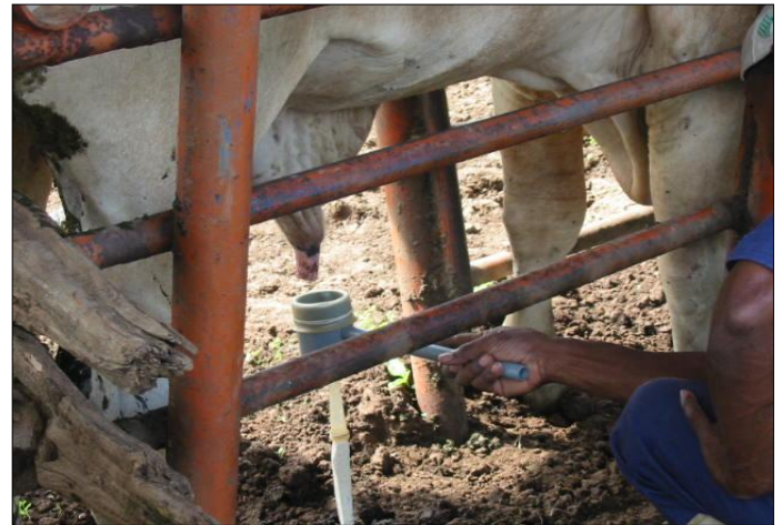
Fotografía 3. Colección del semen de toro.