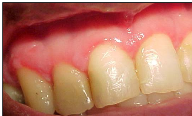
Fig. 3. Desprendimiento del epitelio en la encía marginal e insertada. Gingivitis descamativa crónica. Maxilar superior.