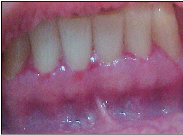
Fig. 4. Desprendimiento del epitelio en la encía marginal e insertada. Gingivitis descamativa crónica. Maxilar inferior.