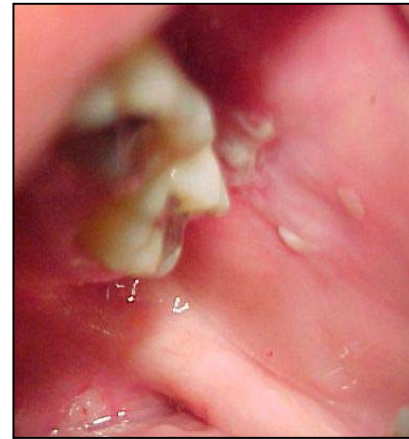
Fig. 7. Lesión en la mucosa del carrillo, en la línea de oclusión.

Se procedió a realizar interconsulta con el dermatólogo, observándose lesiones cutáneas generalizadas. El dermatólogo indicó: azatioprina 180 mg, derain local, fluconazol 150 mg y prednisona 100 mg por día, disminuyéndose la dosis de esta última hasta llegar a 5 mg.