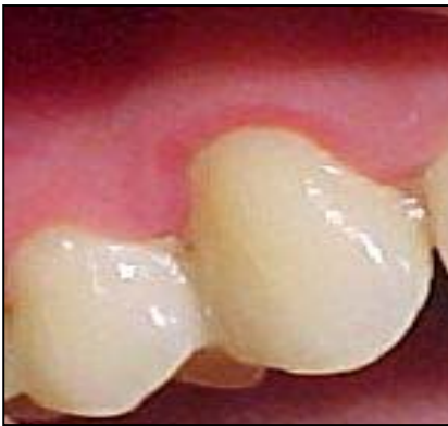
Fig. 6. Zona eritematosa en el margen gingival. Gingivitis descamativa crónica.

Se procedió a realizar interconsulta con el dermatólogo, observándose lesiones cutáneas generalizadas. El dermatólogo indicó: azatioprina 180 mg, derain local, fluconazol 150 mg y prednisona 100 mg por día, disminuyéndose la dosis de esta última hasta llegar a 5 mg.