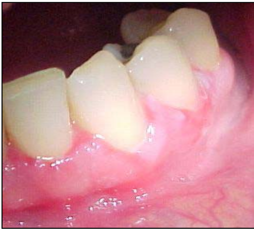
Fig. 5. Zona eritematosa en el margen gingival. Gingivitis descamativa crónica.