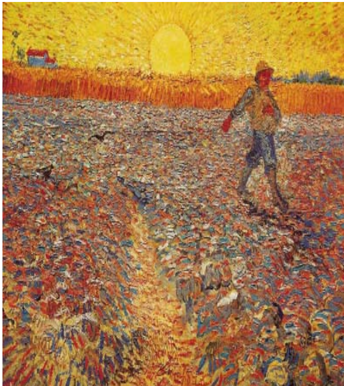
The Sower, 1888 Oil on canvas, 64x 80,5 cm Rijksmuseum kröller-Müller, Otterlo, the Netherlands Vincent van Gogh (1853-1890)